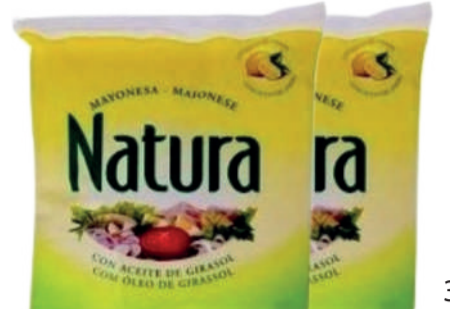
NATURA MAYONESA PORCIONES 8G 192U